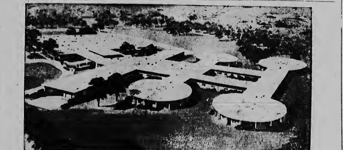
In Upton, Long Island N.Y. zal een enorme atome lisch centrum worden gebouwd, waarvan bovenstaande maquette een voorbeeld is. Het complex zal pim 12 miljoen gulden kosten. De modernste geesteswijzen met radio actieve stoffen zullen hier worden toegepast. In elk van de vier ronde gebouwen zullen patienten worden verzorgd, in het langwerpige gebouw links zullen de verschillende laboratoria en behandelingskamers komen.

PARIS: De effectenbeurs van Parijs kon zich gisteren herstellen, voortaan voor de Franse fondsen. Ook de stemming op de goudmarkt was kalmer en de prijs van haar goud daalde.